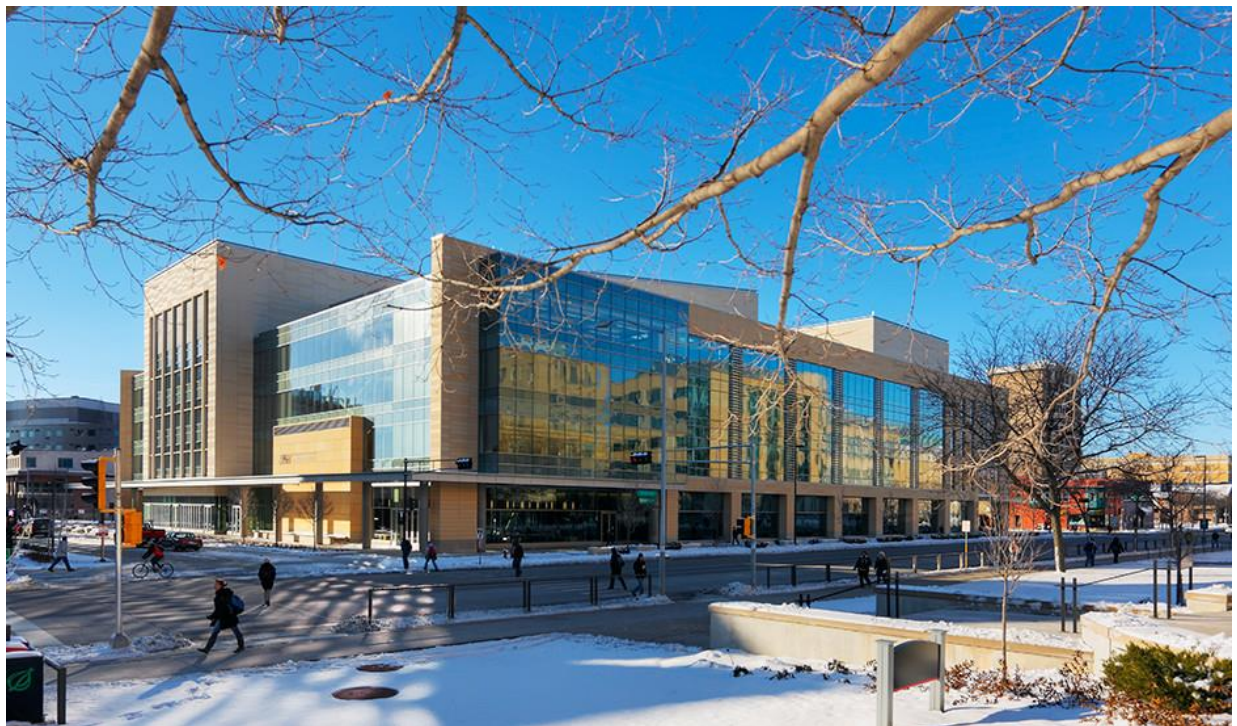
写真 1 Discovery Building (キャンパスの中心に位置しているディスカバリービルディングはコラボレーション、コミュニティ形成、および交流のために建設され、大学発イノベーションの中核となる施設である.)